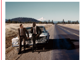
© Lee Shulman & Omar Victor Diop

リー・シュルマン & オマー・ヴィクター・ディオプ 嶋臺(しまだい)ギャラリー 東館 SHIMADAI GALLERY East Supported by agnès b.